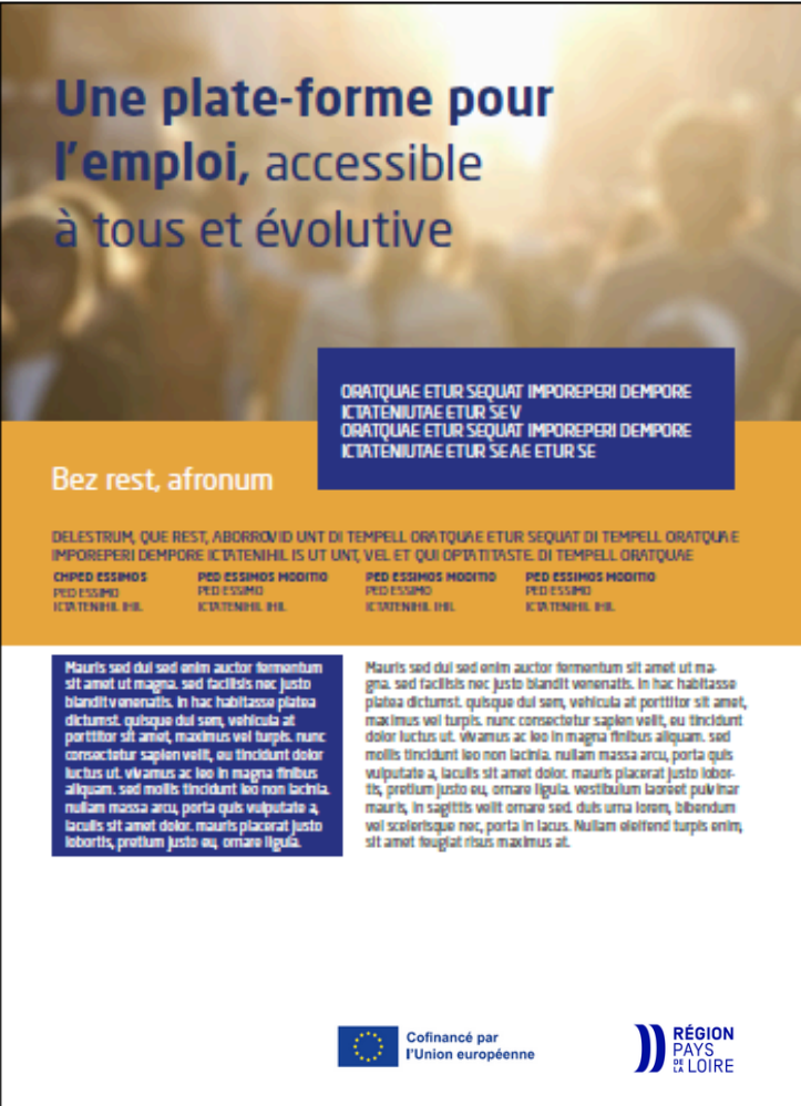
Exemple de brochure